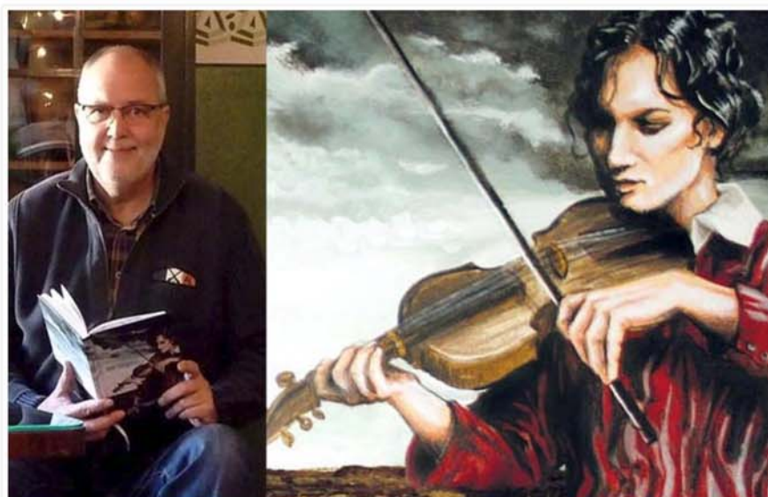
Autor Klaus W. Hoffmann hat den historischen Roman für junge Leute ab 12 Jahren geschrieben

„Die Geigerin“ ist ein packendes Jugendbuch über die blutige Völkerschlacht im Oktober 1813 bei Leipzig. Eine spannende Geschichtsstunde.